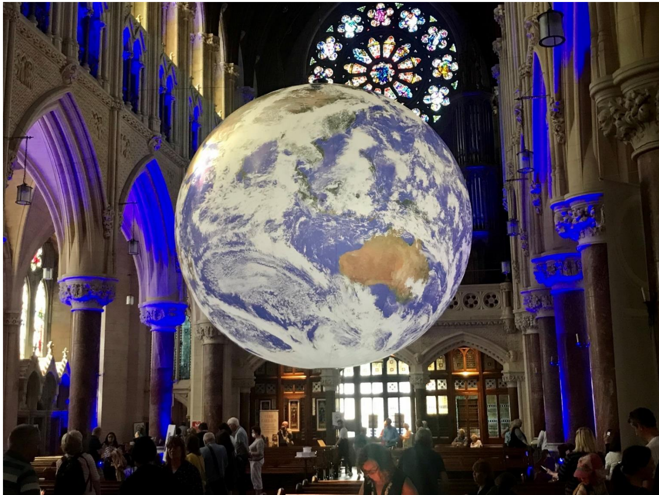
Bild: Gaia Installation in St. Colmans Kathedrale in Cobh

Liebe heimgekehrte Urlauber, und auch liebe Daheimgebliebene,